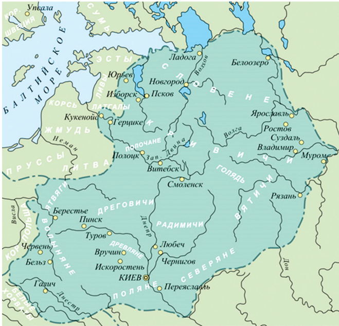
Рис. 4. Карта расселения восточнославянских племен, упоминаемых в связи с терминологией о «славянском политогенезе» и «союзах восточнославянских племен».

не племена, а племенные союзы, должны были поддержать «полянскую» гипотезу происхождения Руси.