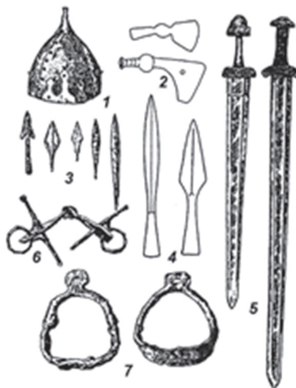
Рис. 3. Комплект вооружения славянского воина в X–XI вв.*

1 — шлем; 2 — топоры; 3 — наконечники стрел; 4 — наконечники копий; 5 — двулезвийные мечи; 6 — удила с псалиями; 7 — стремена.