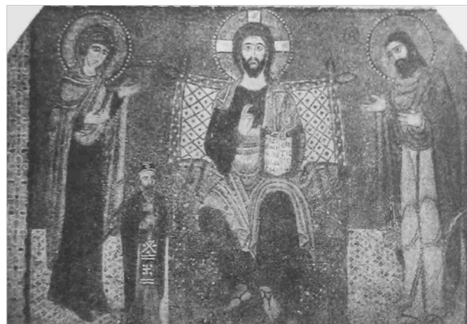
Рис. 9 Аналогія Т. Куделко до реконструкції композиції на південній стіні середньої кліті південної нави.

відповідність ґрунтувалася винятково на наявності на фресці решток двох німбів по обидва боки від Спасителя (Рис. 5), а образ жінки ліворуч, яка визирає з-за завіси архітектурної споруди (Рис. 6), було проігноровано 30 .