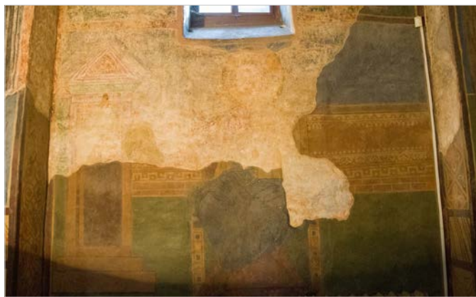
Рис. 2 Рештки фрескової композиції на південній стіні середньої кліті південної нави. Так звана «ктиторська композиція».

Напевно, найвагомим аргументом на користь бодай якоїсь участі княгині Всеволожої в ктиторських заходах, окрім опосередкованого свідчення літописного некролога, можна вважати так звану «ктиторську композицію» південної стіни середньої кліті південної нави (Рис. 2). Наш погляд на таку атрибуцію решток фрески цієї ділянки стисло викладено в раніше опублікованій статті 12 , тепер же зупинимося на цьому детально.