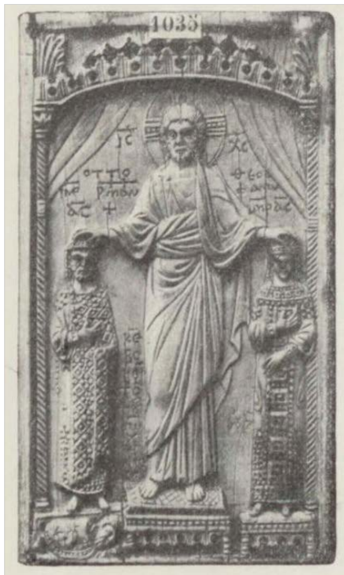
Рис. 8 Аналогія Т. Куделко до реконструкції композиції на південній стіні середньої кліті південної нави.

У 1994 р. дослідниця Т. Куделко зробила припущення про патрональне спрямування цієї композиції 28 на підставі аналогій, які вона знайшла в монографії Н. Кондакова (Рис. 8, 9) 29 . До того ж така