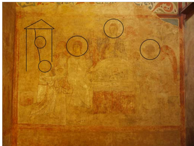
Рис. 10 Фреска «Старозавітна Трійця» («Гостинність Авраама») Софійського собору Києва.

Отож верхня частина так званої «ктиторської композиції» Кирилівської церкви за системою розміщення образів (Рис. 5) майже ідентична композиції «Старозавітна Трійця» («Гостинність Авраама») Софійського собору Києва XI ст. (Рис. 10) 40 .