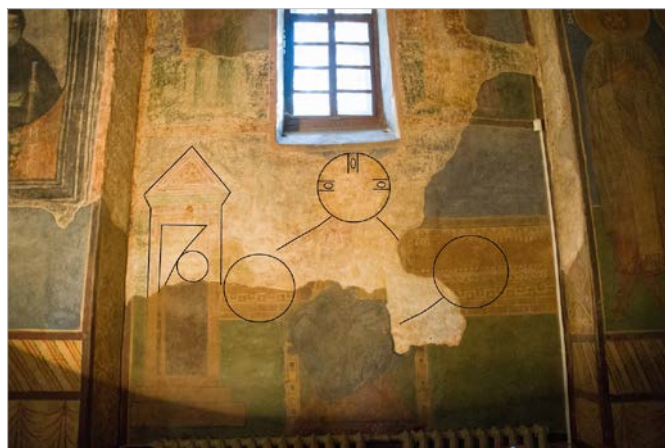
Рис. 5 Прорис складових давньої іконографії решток композиції на південній стіні середньої кліті південної нави.

завершувалася пеленою або рівнем давньої підлоги; верхня ж відокремлювалася червоною лінією розмежування, за якою починається новий регістр розписів середньої кліті південної стіни 24 .