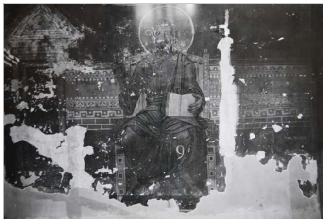
Рис. 7 Поновлення фрески олійними фарбами на південній стіні середньої кліті південної нави.

(Рис. 7) 26 . Припускаємо, що керівник робіт А. Прахов не зрозумів загальної іконографії, тож було вирішено обмежитися лише поновленням фігури Спасителя та архітектурних куліс з обох боків від нього 27 .