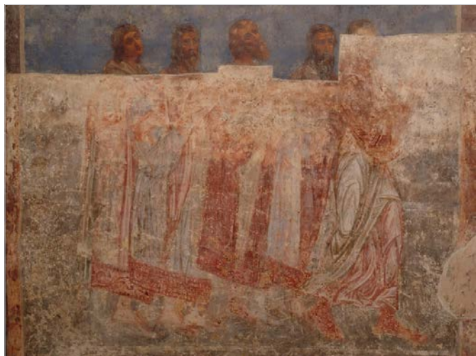
Рис. 4 Сюжет «Лик князів» композиції «Страшний суд». Поховальний портрет князівської усипальні.

Стосовно ж збереженого фрагмента постаті (Рис. 3), то ми погоджуємося із спостереженнями Н. Козака щодо фронтального її пропису 23 . Не виключаємо, що на фресці західної стіни наосу, подібно до копії малюнка А. ван Вестерфельда, було зображено засновника роду, князя Святослава Ярославича. На нашу думку, у такому разі князь Всеволод Ольгович міг бути прописаний із храмом в руках ліворуч цієї фігури, а його сини, князі Святослав та Ярослав Всеволодович, – праворуч від тронного Христа, що містився у центрі композиції.