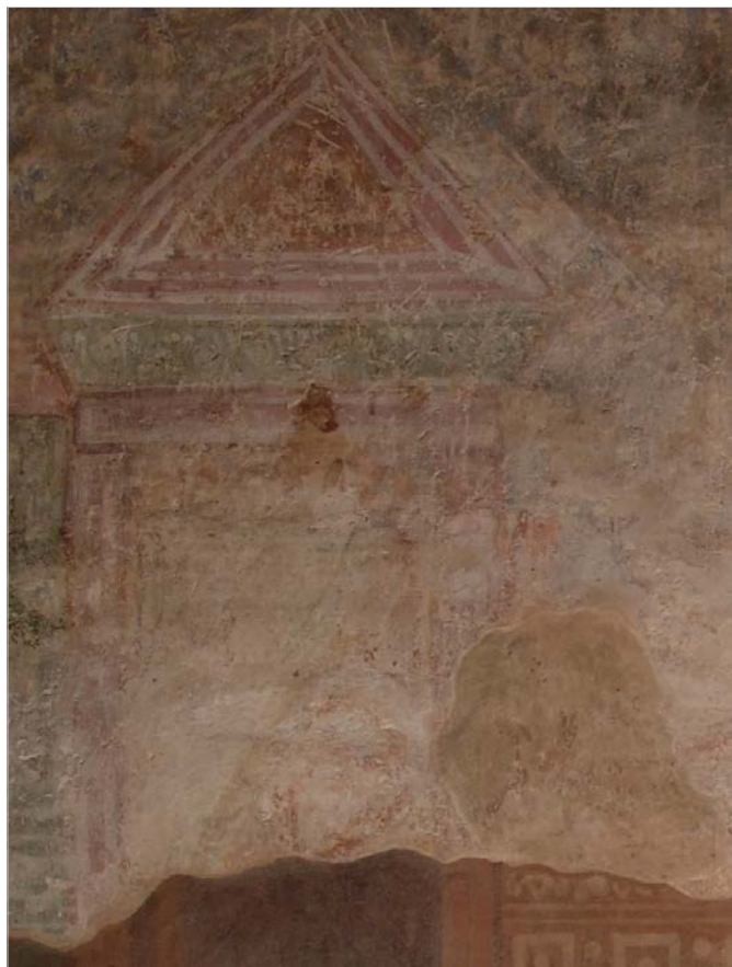
Рис. 6 Образ споглядаючої жінки з решток композиції на південній стіні середньої кліті південної нави.

Імовірно, першу спробу атрибуції цих фрагментів стінопису слід пов'язувати з ремонтно-реставраційними роботами в храмі на поч. 80-х рр. XIX ст. 25 Рештки стінопису південної стіні середньої кліті південної нави після розкриття поновили олійними фарбами, але замість багатофігурної композиції на цій ділянці прописали однофігурну