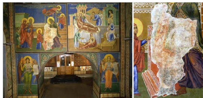
Рис. 3 Рештки фрески композиції на західній стіні наосу. Реальна ктиторська композиція.

олійного живопису кін. ХІХ ст. на західній стіні наосу рештки давнього тиньку на площині 180х90 см зі збереженим фресковим фарбовим шаром, який, найімовірніше, і містить частину реальної ктиторської композиції храму (Рис. 3) 13 .