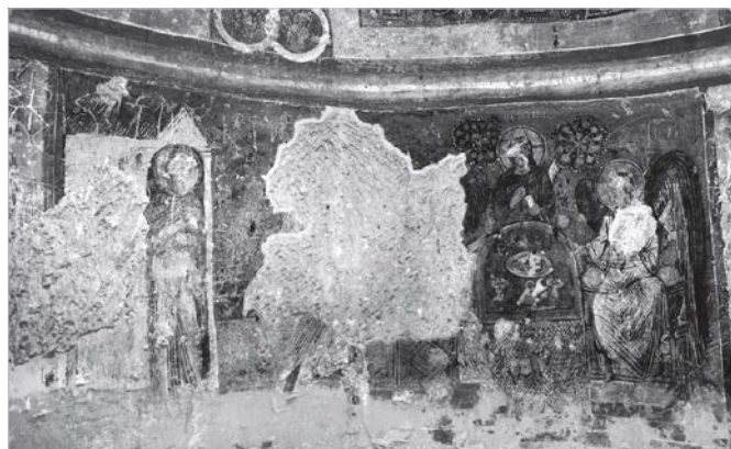
Рис. 11 Фреска «Старозавітна Трійця» («Гостинність Авраама») каппадокійської церкви Токалі-Кілісі в м. Гереме, Туреччина.

фрески південної стіни середньої кліті південної нави Кирилівської церкви, тобто так званій «ктиторській композиції» за визначенням дослідниці Т. Куделко.