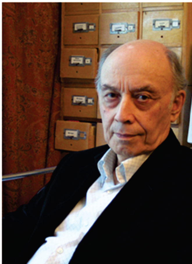
Лев Самуилович Клейн, выдающийся ученый, историк и археолог, один из основателей Европейского университета

Ответ на этот вопрос искали многие историки, суть ответа сводится к тому, что до времени Владимира русь частично уже была крещена и, возможно, не один