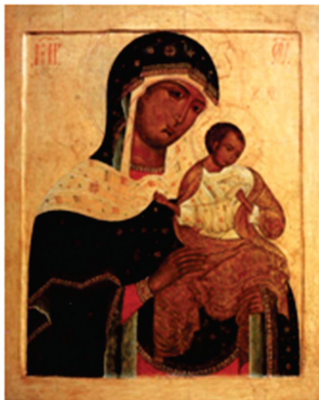
Икона Богоматери Коневской (кон. XV в.)

Данная святогорская икона в России получила устойчивое название Богоматери Коневской. Предание связывает этот афонский образ с известной коневской иконой – на нем изображены Божья Матерь, а на