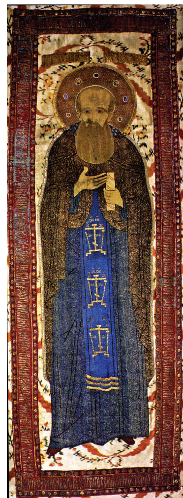
Арсений Коневский. Покров (1551 г).