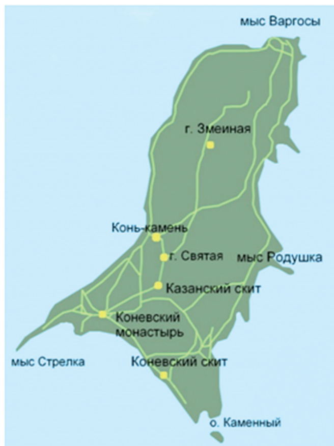
План острова Коневец

В пересказе Жития в изданиях XIX в. говорится, что Арсений Коневский добрался и до Валаамского монастыря, который находится на одноименном острове на севере Ладожского озера. Но там было слишком многолюдно, поэтому он вернулся на Коневец 30 . В списках Жития прп. Арсения данный эпизод неизвестен. Н. А. Охотина-Линд относит его к творчеству коневского игумена Илариона, который переработал и дополнил Житие; в таком виде оно было опубликовано в 1850 году 31 . Это известие отдаленно напоминает сюжет о пребывании на Валааме прп. Савватия Соловецкого, который удалился оттуда, «видя себѣ чтима от игумена и от братии» 32 . Тем не менее, в «Сказании о Валаамском монастыре» (1560-х гг.) говорится о дружбе прп. Арсения и Сергия Валаамского, когда валаамский игумен Пимен вез из Великого Новгорода обретенные мощи прп. Сергия мимо Коневца: «Той же игумен Пимин въспомяну онѣхъ святыхъ обоихъ начальникъ — валаамского Сергия и коневского Арсения — егда въ плоти живяху, съвершенную Христову любовь меж себе имяху, бяху бо въ еди на лѣта оба бѣста», — это единственное раннее свидетельство о контактах между