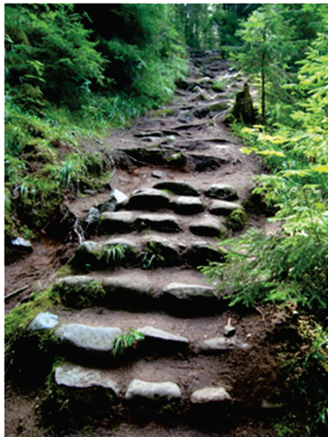
Путь на «Святую гору» Коневца

Спустя какое-то время после основания монастыря иеротопическое оформление продолжилось. Житие повествует, как на горе, где изначально подвизался прп. Арсений, иноки воздвигли второй крест, имевший памятное значение. Он был посвящен явлению Богородицы одному из старцев обители и чуду спасения братии от голода во время второго паломничества прп. Арсения на Афон. Рядом с крестом монахи поместили икону Коневской Божией Матери, а само место отныне стали называть «Святой горой» 43 . Она была излюбленным объектом почитания иноков и паломников: «Братия же и приходящие православию христиане начаша ходити